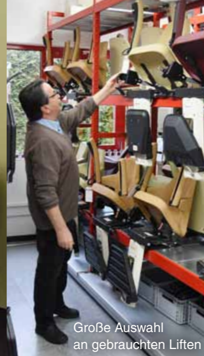
Große Auswahl an gebrauchten Liften