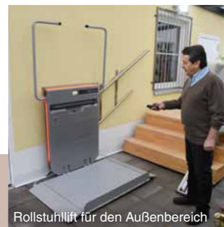
Rollstuhllift für den Außenbereich